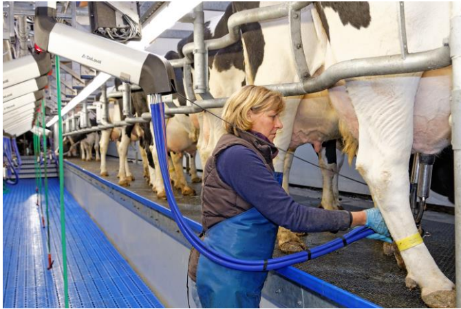
Bild: ML3100 mit MSA30 beim Melken.