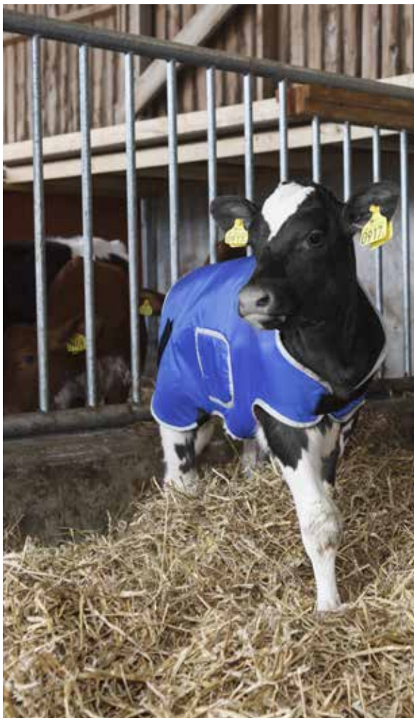
Effet de la température ambiante sur les exigences de maintenance du veau

Un manteau pour veau DeLaval est un moyen simple d'aider les veaux à la rétention de chaleur quand la température baisse. Ceci permet de minimiser leurs efforts pour maintenir une température corporelle optimale.