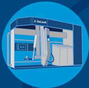
DeLaval VMS™ -sarja