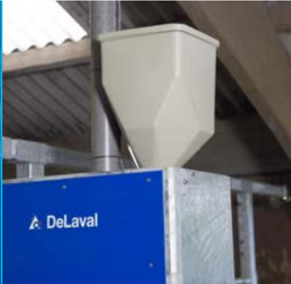
Distributeur de minéraux