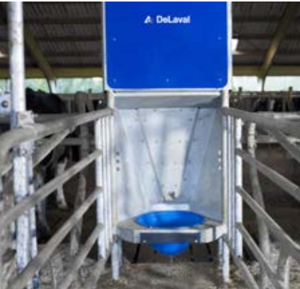
Système d'alimentation programmée FSC40 DeLaval