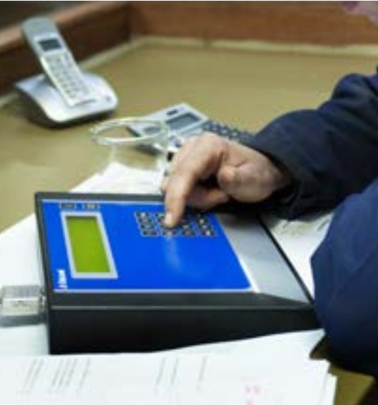
Processeur d'alimentation FP204X DeLaval