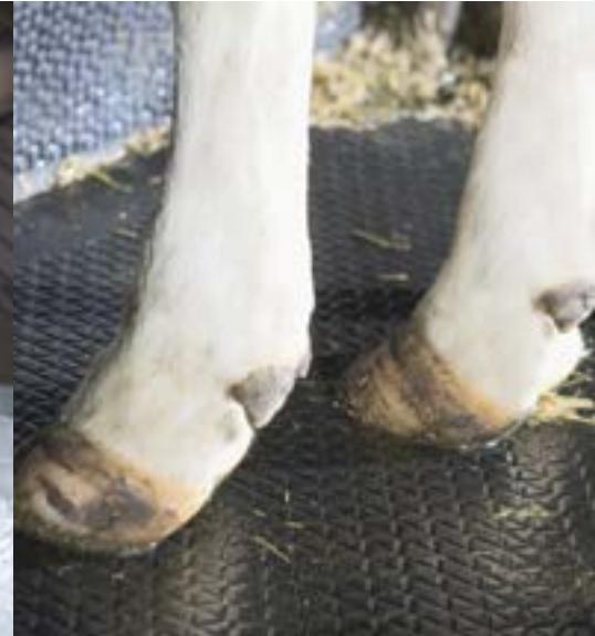
Tapis caoutchouc RM21S DeLaval