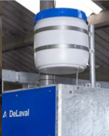
Distributeur d'aliments liquides LD1000 DeLaval