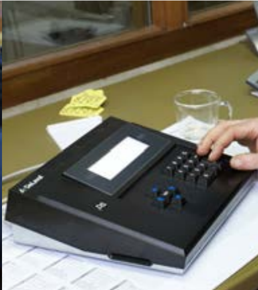
Processeur d'alimentation ALPRO™ DeLaval