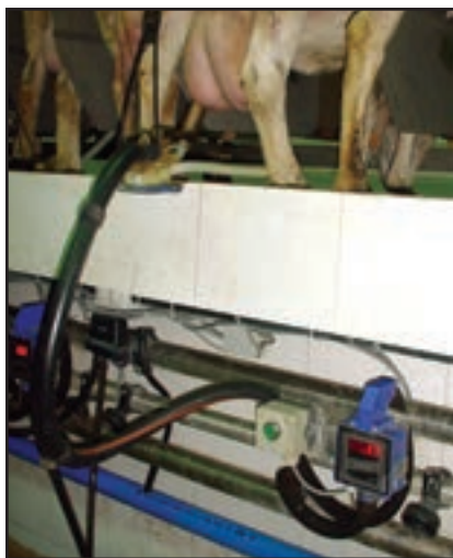
Compteur à lait MM25 SG dans une salle de traite en ligne basse.

DeLaval Inc. 2020, Fisher Drive CA-Peterborough, ONT K9J 7B7 Canada Téléphone : 705.741.3100 Télécopie : 705.741.3150