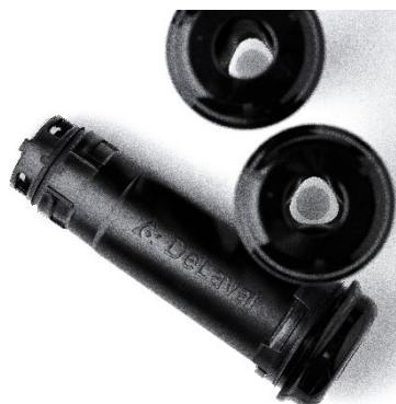
Cartouches DeLaval Evanza™