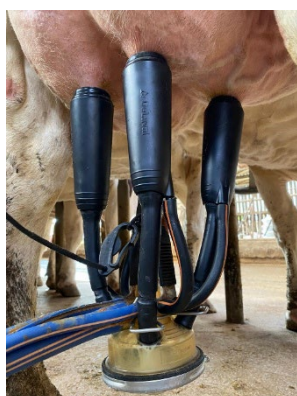
Faisceaux DeLaval Evanza™ Retrofit léger en traite