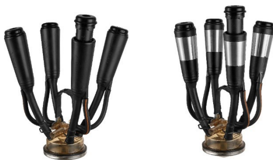
Faisceaux DeLaval Evanza™ Retrofit (griffe Harmony™ et kit de rénovation DeLaval Evanza™ Retrofit) Version légère à gauche et semi-légère à droite

Le kit de rénovation DeLaval Evanza™ Retrofit sera commercialisé par les concessionnaires français du réseau DeLaval à partir du 02/02/2026. Le tarif du kit de rénovation avoisinera les 220€/poste, un tarif qui se veut attrayant, afin de rénover le parc existant facilement et sans gros investissement.