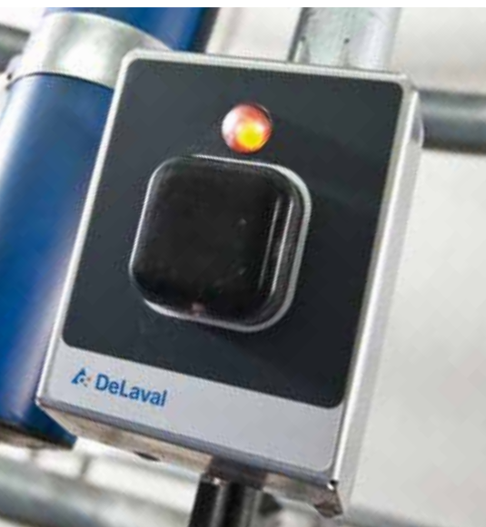
Die Melkphasen werden durch Farbcodes angezeigt

Die DeLaval MPC150 Melkzeug-abnahme reduziert Ihre Gesamt-melkzeit und führt zu schnelleren Melkrhythmen. Das geradlinige Design ermöglicht eine einfache Handhabung und bietet einen exzellenten Melker- und Kuhkomfort.