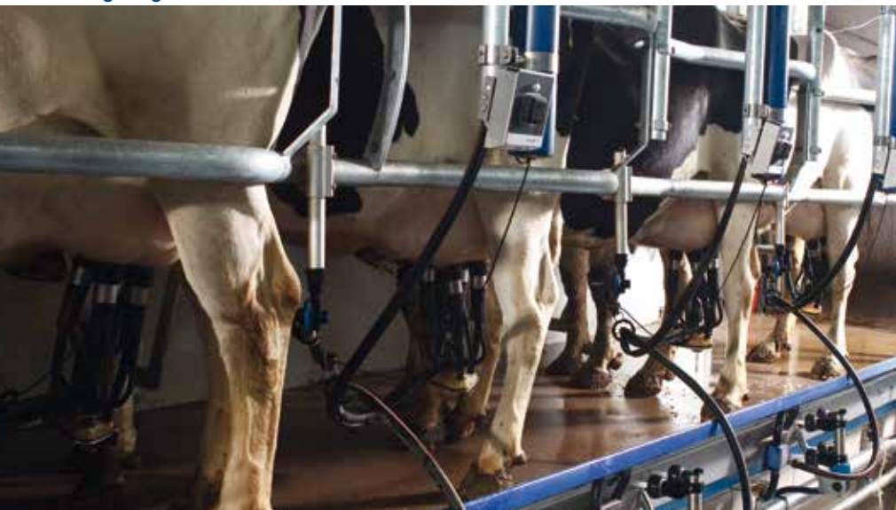
MPC150 ist passend für alle bekannten Melkstandtypen.

Standardmässig ist der MPC150 mit melkplatzindividueller Pulsation und Pulsationsstop nach Abnahme ausgerüstet. Eine zentrale Steuereinheit ist nicht notwendig. Um einen schnellen und schonenden Milchentzug zu ermöglichen, kann standardmässig die zeitgesteuerte Hochfrequenz-Pulsation als Stimulation genutzt werden. Als Zusatzoption (mit FI5 D) kann die milchflussgesteuerte Stimulation (Duovac) mit reduziertem Melkvakuum bei niedrigem Milchfluss gewählt werden.