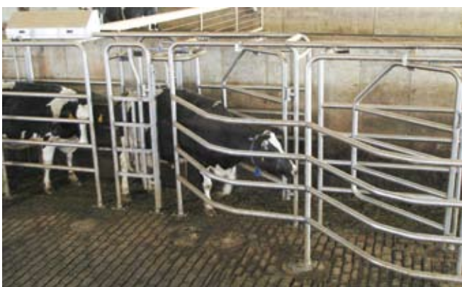
DeLaval Sortiertore DSG10 in Edelstahl