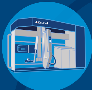
DeLaval VMS™ Serie

Daarom richten wij ons niet alleen op één onderdeel van het melkproces. Wij ontwerpen, vervaardigen, installeren en onderhouden complete systemen en staan in voor kwaliteit en betrouwbaarheid van elk onderdeel van die systemen.