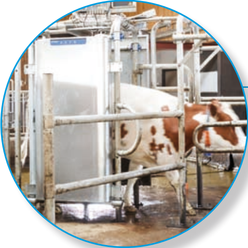
Kuhidentifikation und automatische Sortierung