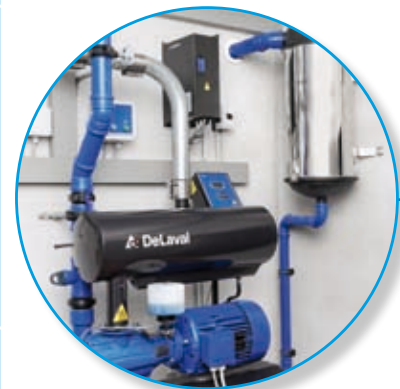
Vakuumpumpen mit NFO Frequenzsteuerung