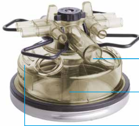
Centrale pijp voor bovenafvoer en laminaire melkafvoer.