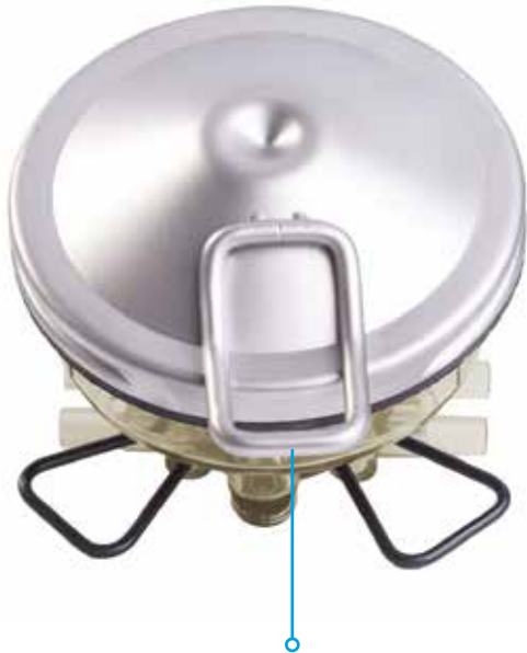
Vierkante, gesloten haak voor goede grip.