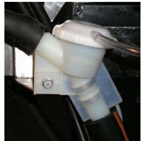
Le capteur de débit de lait HFC DeLaval ne comporte aucune pièce en mouvement à l'intérieur