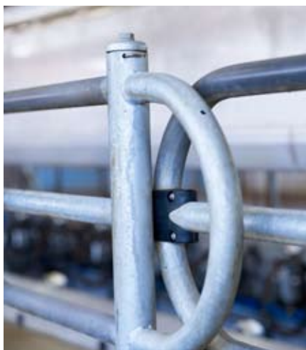
Portillons munis d'un amortisseur de bruit et d'un ressort