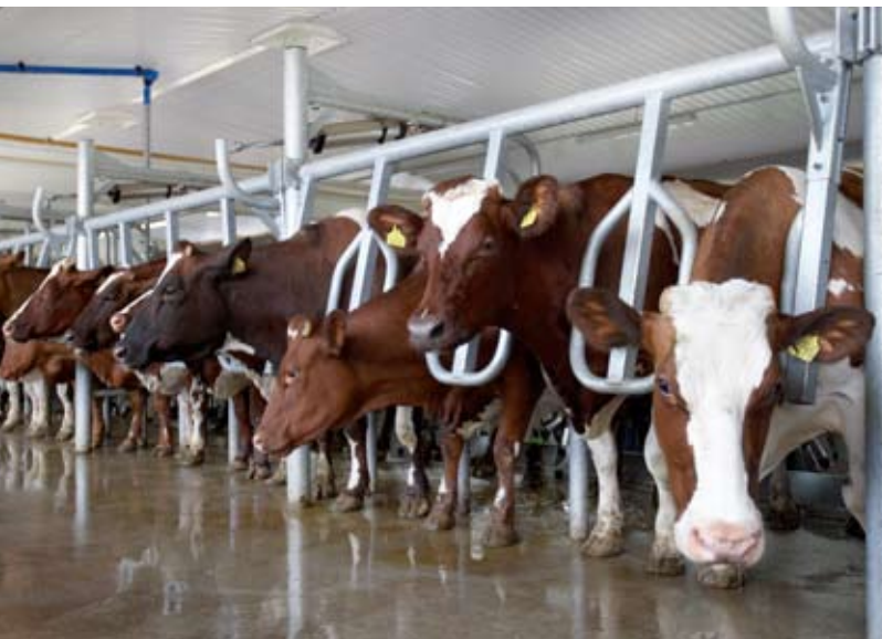
Position naturelle pendant la traite