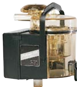
Le MM15 DeLaval mesure le poids réel du lait

Vous pouvez aussi utiliser le rideau d'identification bleu DeLaval.