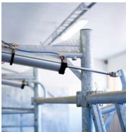
Vérin pneumatique double effet pour la sortie frontale et l'indexation

Les différents niveaux de pression d'air requis peuvent être définis indépendamment.