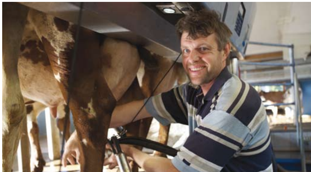
Accès aisé à la mamelle pour le confort du trayeur

La position et la conception du pare-bouses jouent aussi le rôle de barre anti-coup de pattes. La manière dont le pare-bouses et la bordure de quai sont positionnés empêche la vache de donner des coups de pattes au trayeur ou de tomber dans la fosse.