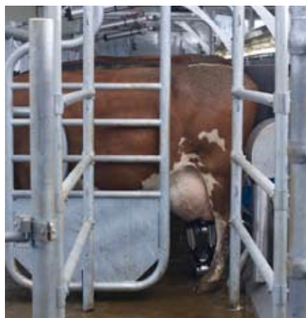
La porte d'entrée coulissante positionne doucement la dernière vache pour la traite