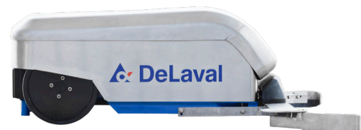
DeLaval RS450S robotskraper for spaltegulv.

Mange foretrekker robotens systematiske rengjøring av spaltearealet fremfor et fast skrapesystem. Hvert område blir rengjort til fast tid. Det dyrevennlige gjødselrobotsystemet fungerer i alle typer planløsninger, og er lett å tilpasse når du vil gjøre endringer i kjøreskjemaet.