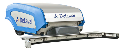
DeLaval RS450S robotskraper for spaltegulv med vannspyling.